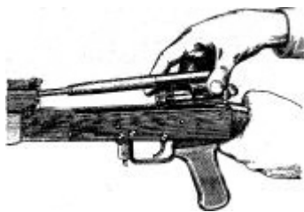
Отделение затворной рамы с затвором