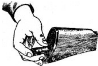
Укладка пенала в гнездо приклада