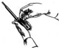
Отделение затвора от затворной рамы