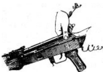
Отделение крышки ствольной коробки

Отделить возвратный механизм. Удерживая автомат левой рукой за шейку приклада, правой рукой подать вперед направляющий стержень возвратного механизма до выхода его пятки из продольного паза ствольной коробки; приподнять задний конец направляющего стержня и извлечь возвратный механизм из канала затворной рамы.