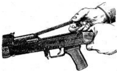
Отделение возвратного механизма